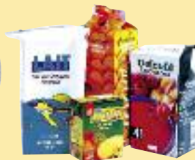
Briques de lait, de jus de fruits et de soupe