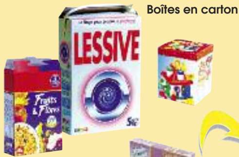
Boîtes en carton