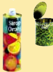
Bidons de sirop de fruits