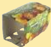
Suremballages en carton