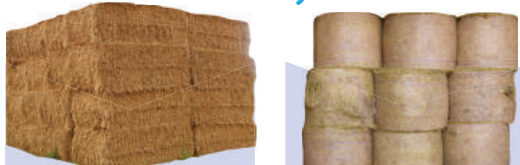
Conditionnement des fourrages, palissage vigne et horticulture