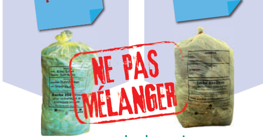
en saché de 250 L